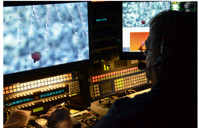
Un ingeniero de video ajusta el zoom, el enfoque y la iluminación de la cámara principal de alta definición del ROV Deep Discoverer para obtener la mejor toma de una pequeña medusa.